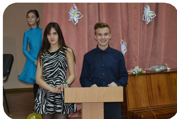
Ведущие концерта к 8 марта