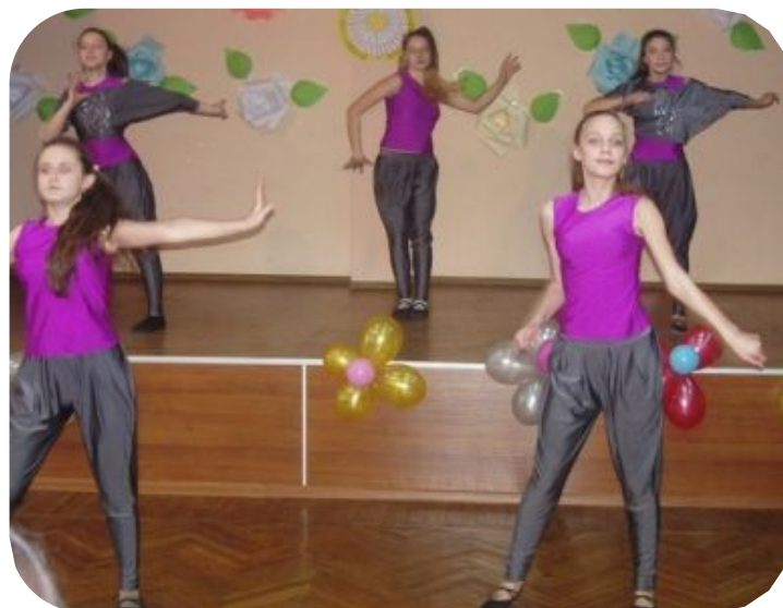
Поздравления к 8 марта