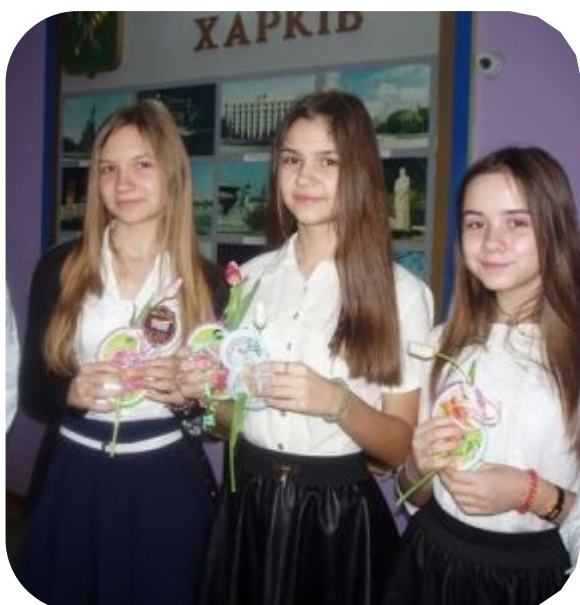
Ярмарка к Дню Влюбленных