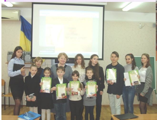
Учасники конкурсу– наші майбутні зірки