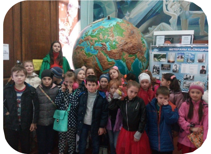
Експерсія до Планетарію 2-Б клас (класний керівник Дегтяр В.А.)