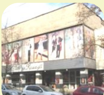
Харківський академічний театр музичної комедії