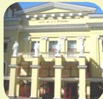
Харківський академічний російський драматичний театр ім. О. С. Пушкіна