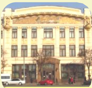
Харківський державний академічний театр ляльок ім. В. А. Афанасєва