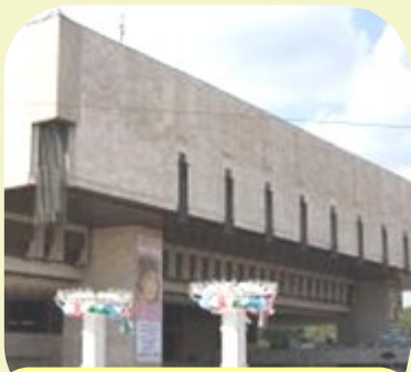
Харківський національний академічний театр опери та балету ім. М. В. Лисенка