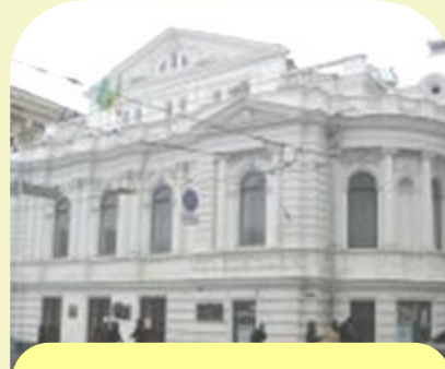
Харківський державний академічний український драматичний театр ім. Т. Г. Шевченка