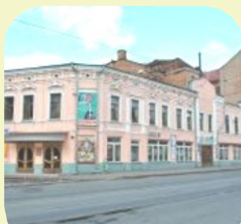
Харківський театр для дітей та юнацтва